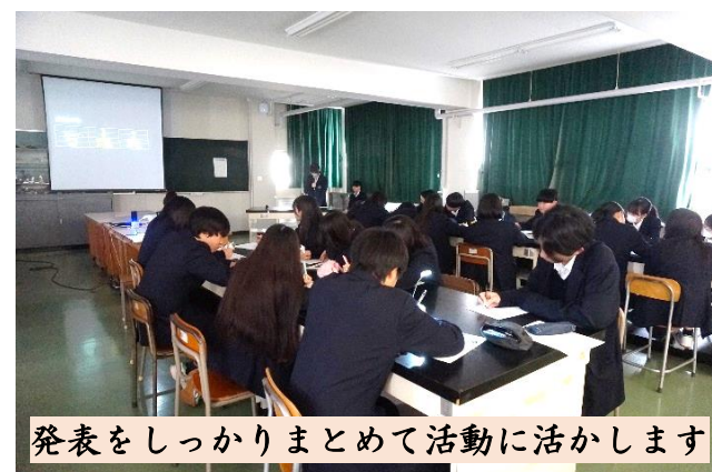
発表をしっかりとめて活動に活かします