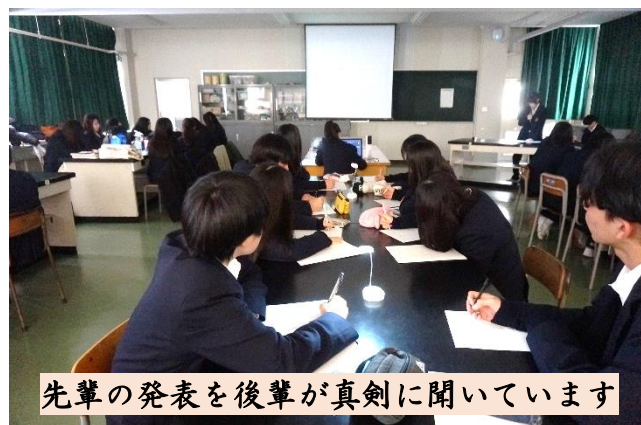
先輩の発表を後輩が真剣に聞いています